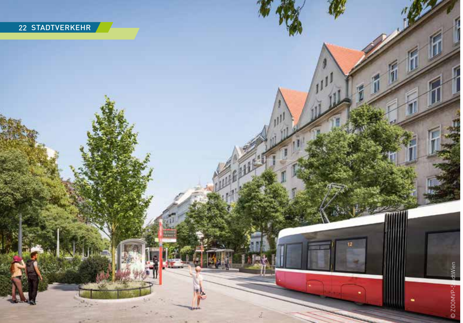
Die Linie 12 in der Vorgartenstraße