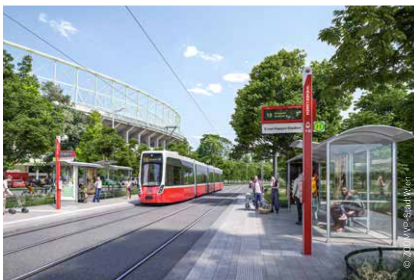
Die Linie 18 beim Ernst-Happel-Stadion

Schaden wie längere Fußgänger-Querungen oder schmälere Gehsteige anrichten. Nicht ganz ideal ist die Beibehaltung der Blockumfahrung bei der U3-Station Schlachthausgasse, hier wird zugunsten eines sehr kurzen barrierefreien Umsteigeweges eine Fahrzeitverlängerung in Kauf genommen. Weiterer Wermutstropfen: In der Stadionallee bleiben die Parkplätze der Kleingärtner erhalten, hier ist künftig die MIV-Durchfahrt durch den Prater gesperrt – was für ein Anachronismus, in wertvollstem Grünland weiterhin blechgesäumte Straßen zu akzeptieren! Dafür haben sich andere lang vorgeschobene Verhinderungsgründe in Luft aufgelöst: Die Querung der als Spazier- und Laufstrecke genutzten Hauptallee, für die sogar eine Straßenbahnunterführung gefordert wurde, erfolgt ohne