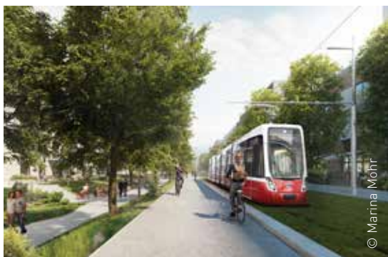
Die Linie 27 in der Hirschstettner Hauptallee

Auch diese Linie ist schon seit 2015 angekündigt. Notwendig wird sie durch die Umwidmung des Nordwestbahnhof-Areals in ein Stadtentwicklungsgebiet: Dieser ehemalige große Güterbahnhof im 2. Bezirk soll ähnlich wie das Areal um den Hauptbahnhof oder den Nordbahnhof zum neuen Stadtviertel werden, mit 10.000 Wohnungen und 20.000 Arbeitsplätzen. Derzeit trennt das Areal als Barriere die stadtnäheren Bereiche von denen entlang der Donau im 20. Bezirk. Von