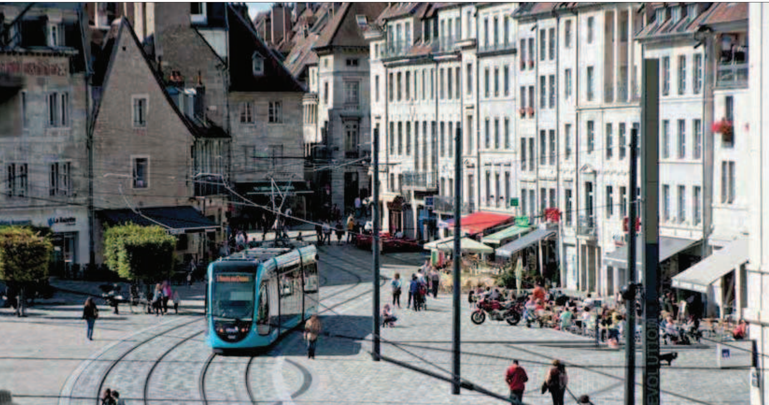
Place de la Révolution in Besançon.